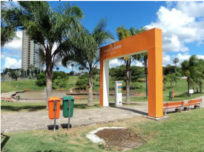
Figura 1 - Parque Germânia

As fotografias, imagens etc. identificar o tipo de ilustração na parte superior, colocar título e nº de ordem; na parte inferior a legenda, a fonte (mesmo que seja do próprio autor), as notas, se for o caso; seguem exemplos: